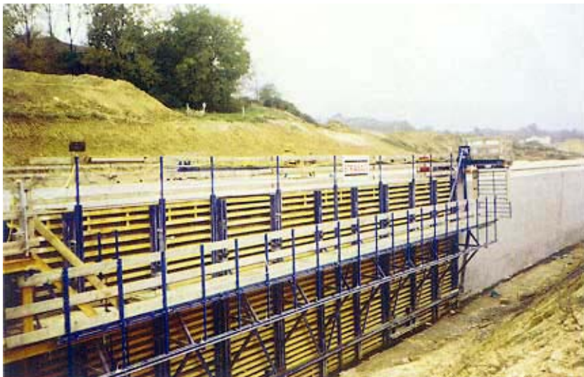
Vanjski zidovi tunela prije nasipanja