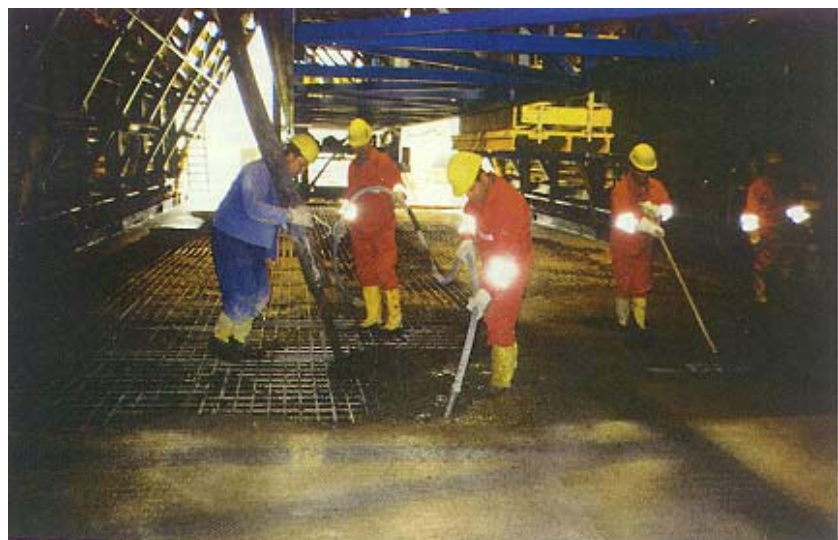
Ugradnja betona u tunelu

temperatura betona bude ispod 42^{\circ} C, a da temperatura na mjestu ugrađivanja bude ispod 24^{\circ} C. U ovom se slučaju monolitna konstrukcija sastoji od neprekinutog slijeda 24 m dugih sekcija građenih u jednom vremenskom odsječku, a istodobno se grade podni, bočni, srednji i stropni zidovi.