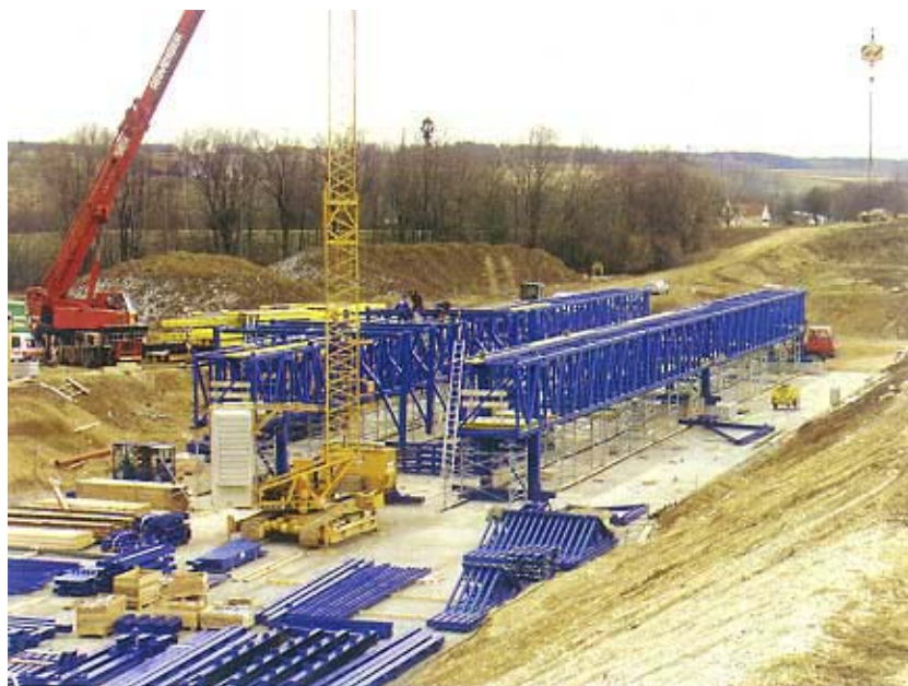
Početak montaže čeličnih greda za oplatu

Posebnost je tunela što je smješten u tlu s mnogo podzemne vode pa se zapravo gradi monolitna i vodone-