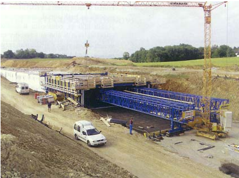
Čelične grede pripremljene za navlačenje oplata

propusna betonska konstrukcija s dvije tunelske cijevi, potpuno u skladu s uputom za vodonepropusne betone propisalo Austrijsko društvo za beton i tehnologiju građenja. Te su upute, temeljene na suvremenoj tehnologiji i omogućuju građenje velikih i vodonepropusnih betonskih sekcija. U njoj je bitno da postignuta