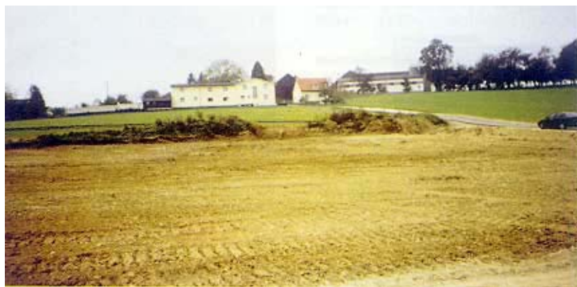
Nasipom prekriveni dio tunela u blizini kuća

meljna ploča i armatura, a započinje se od podnožja zidova. Nakon postavljanja armature, najprije se iz razloga uvjetovanih radijusom tunela beton ugrađuje u središnji zid. Slijede bočni zidovi, a tek na kraju pokrovni zid. Beton se uvijek zbija posebnim vibratorima. Valja istaknuti da je širina tunelskog profila 21,15 m, a visina 5,45 m.