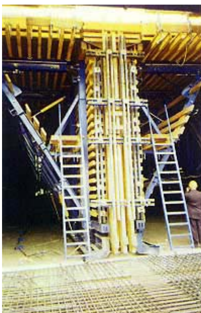
Oplata i skela za pregradni zid tunela

Svaka od ovih 24 m duge sekcije u svoje zidove prima u jednom punjenju gotovo 1000 m 3 betona, koji se ugrađuje s dvije betonske crpke s prosječnim kapacitetom od 35m 3 /h, pa ugradnja traje otprilike 14 sati. Najprije se beton ugrađuje u podnožje, za koje je prije pripremljena te