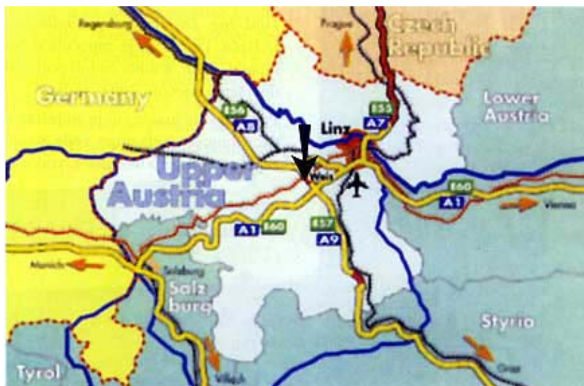
Prikaz mreže autocesta u Gornjoj Austriji (strelica pokazuje položaj tunela Steinhaus)

Inače se pyhrnski cestovni pravac kroz Austriju dijeli zapravo na dva