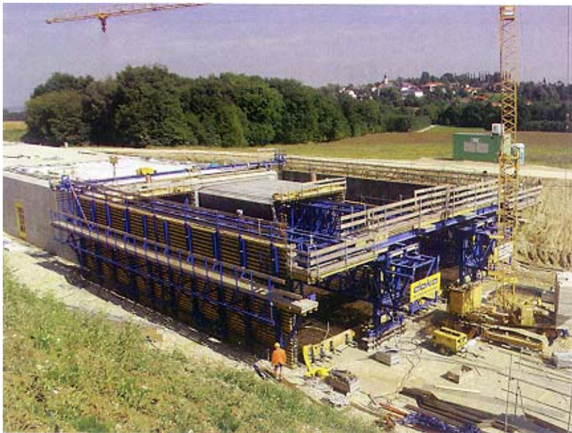
Pogled na gradilište tunela

dijela. Manji dio od njemačke granice, koji se spaja sa glavnom austrijskom autocestom što povezuje Beč sa Salzburgom i Innsbruckom, pripada europskom pravcu E56, a za Austrijance je to A8 koji nazivaju i Innkreis Autobahn, te veći dio, približno 220 km od gradića Sattledta (na A1) u Gornjoj Austriji do Spielfelda u Štajerskoj na rijeci Muri na slovenskoj granici koji pripada europskom pravcu E57, a u Austriji je to A9 ili upravo Phyrn Autobahn. Još se grade dva spoja i na jednoj i na drugoj autocesti. To je dio uz prijevoju Pyhrn, po kojemu je cijeli cestovni pravac i dobio ime, te sjeverniji dio u blizini grada Welsa, zapravo njegova zapadna obilaznica, gdje se i nalazi novi natkriti tunel.